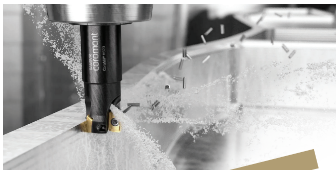
MS20 | R390 | R490