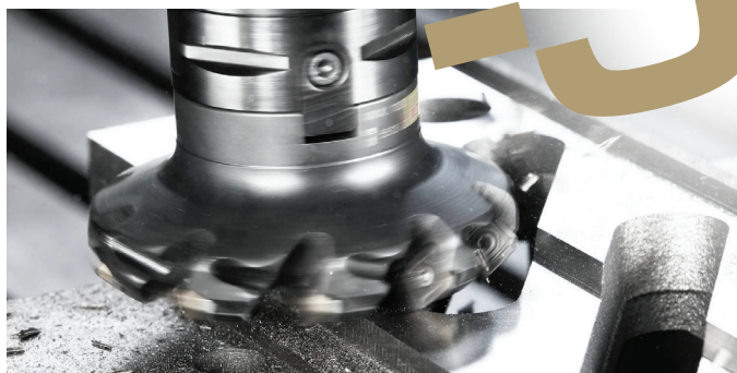
R245 | R345 | MS60 | MS40