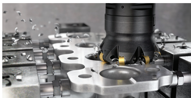
MR80 | R300 | R200